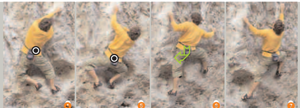
Bild 4: Nicht ökonomisch, manchmal aber nötig – eine seitliche Schwerpunktpositionierung