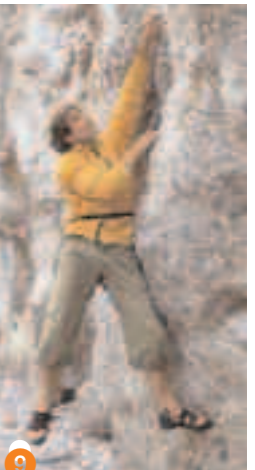
Bild 9: Weiterziehen aus der eingependelten Stellung