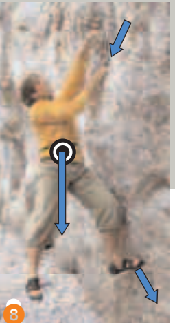
Bild 8: Eingependelte Position mit Pendelbein. Die Pfeile geben die Kraftverteilung auf Hand und Fuß wieder

kann man bewusst auf das Positionieren eines Fußes verzichten und sich einpendeln. Lasse jedoch nie einen Fuß ungenutzt. Ein Pendelbein ist kein vergessener Fuß, sondern ein im Sinne ökonomischer Klettertechnik absichtlich in der Luft hängendes oder schwingendes Körperteil.